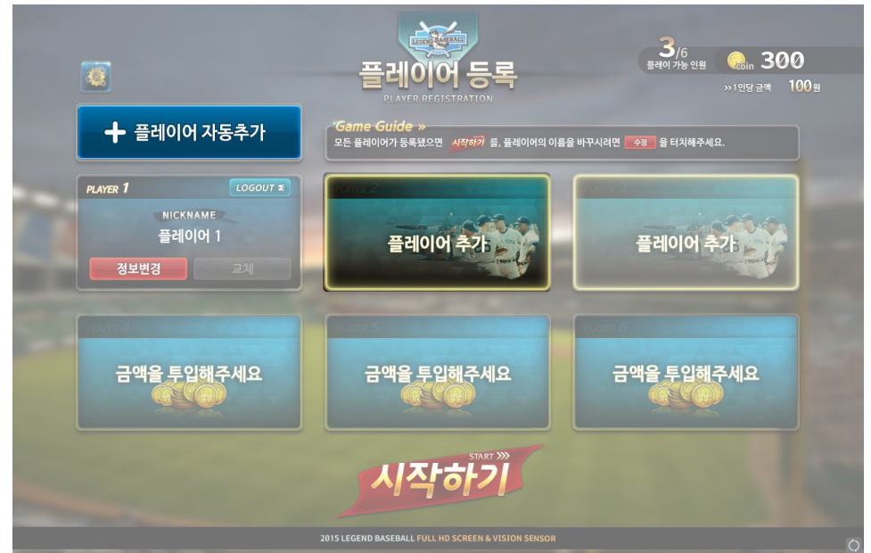
[2인 이상 플레이어 게임 시]