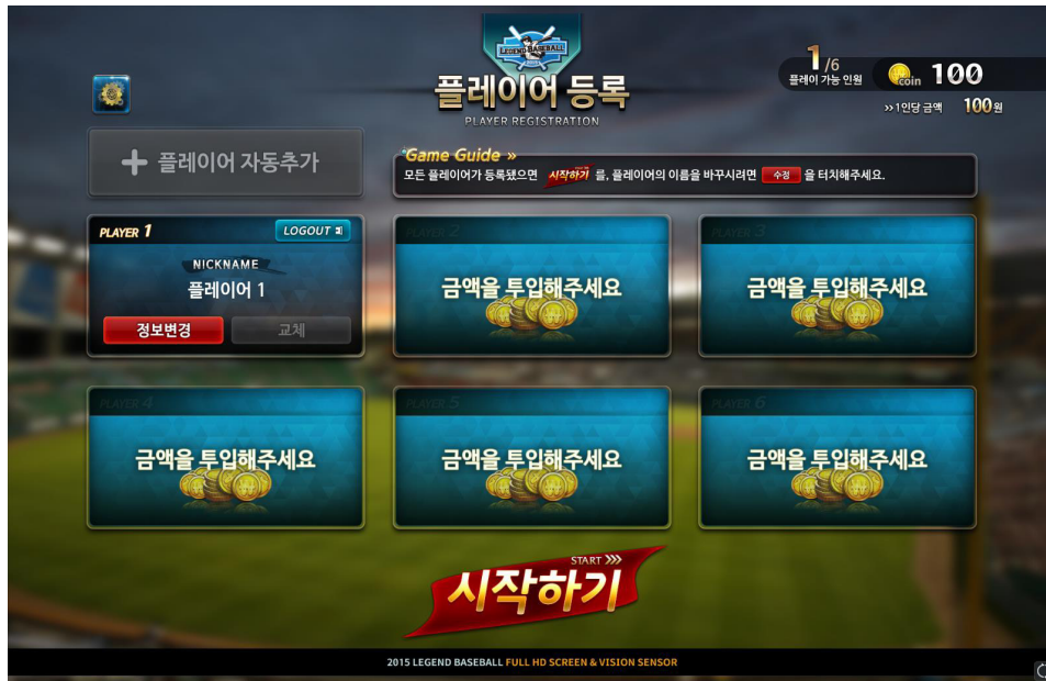
[1인 플레이어 게임 시]